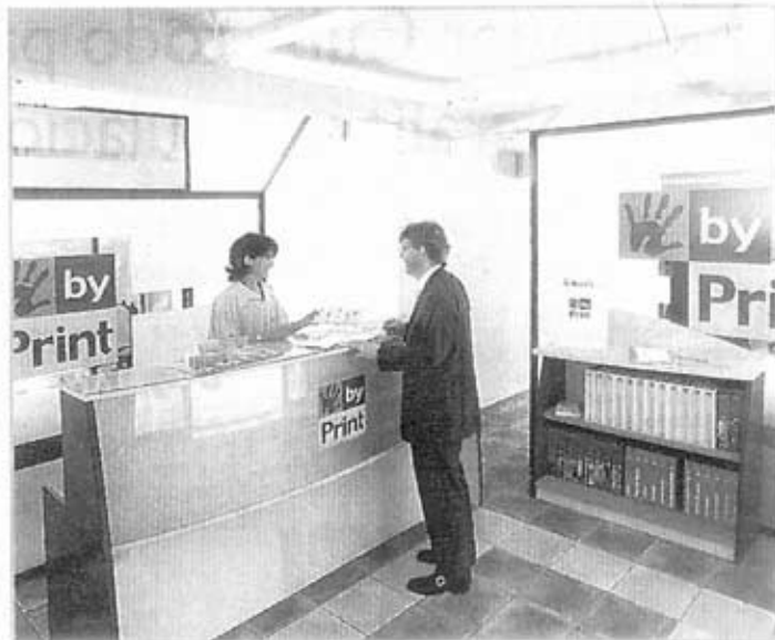
La imagen de By Print ha roto con la de las imprentas tradicionales.