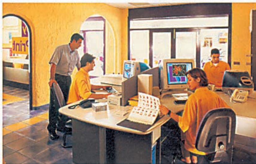
Las enseñanzas españolas By Print y Levico Sharing comienzan a franquiciar sus negocios en este año.

Teniendo en cuenta los datos de las enseñanzas que facilitan la inversión desglosada, para formar parte de este sector hay que desembolsar entre 10,5 millones de pesetas (Advanced Signs, sin obra civil) y 16 o 28 millones (By Print, según maquinaria). Los derechos de entrada a la red oscilan entre cero pesetas (Oroprint) y 3,9 millones (Levico Sharing); cinco de las seis enseñanzas cobran canon de mantenimiento, y tres, canon de publicidad. Los negocios se pueden montar en locales desde 30 hasta 200 metros cuadrados, y en poblaciones de 25.000 a 100.000 habitantes.